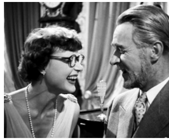
1955 RÊVES DE FEMMES (Kvinnodröm) d'Ingmar Bergman avec Harriet Andersson