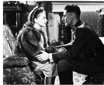
1944 MITT FOLK ÄR ICKE DITT de Weyler Hildebrand avec Sonja Wigert