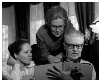
1975 FACE À FACE (Ansikte mot ansikte) d'Ingmar Bergman avec Liv Ullmann, Aino Taube