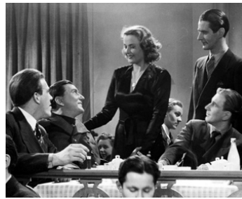
1943 NUIT AU PORT (Natt i hamn) d'Hampe Faustman avec Alf Kjellin, Birgit Tengroth