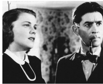
1947 ON DEMANDE UN PAPA (Pappa sökes) d'Arne Mattsson avec Sickan Carlsson