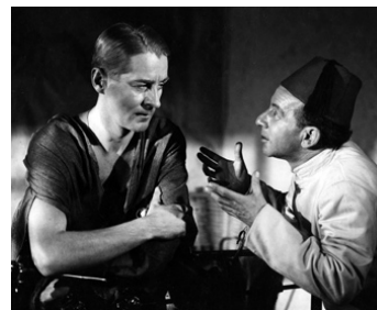
1948 LE TIGRE SUÉDOIS (En svensk tiger) de Gustav Edgren avec Ivar Hallbäck