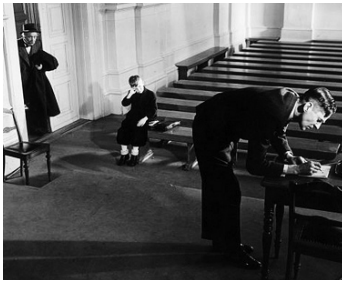
1944 TOURMENTS (Hets) d'Alf Sjöberg avec Olof Winnerstrand