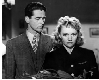
1946 QUAND LA PORTE EST FERMÉE (Medan porten var stängd) d'H. Ekman avec Gunn Wallgren