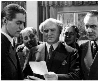
1940 UNE NUIT DE JUIN (Juninatten) de Per Lindberg avec Sigurd Wallen