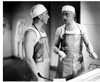
1943 J'AI TUÉ (Jag dräpte) d'Olof Molander avec Anders Henrikson