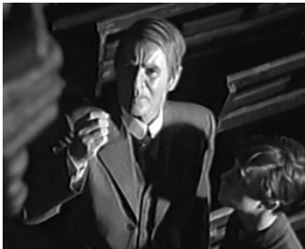
1966 LES FEUX DE LA VIE (Här har du ditt liv) de Jan Troell avec Eddie Axberg