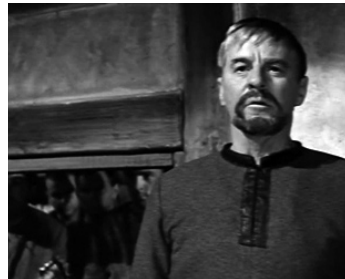
1966 LA MANTE ROUGE (Den røde Kappe) de Gabriel Axel