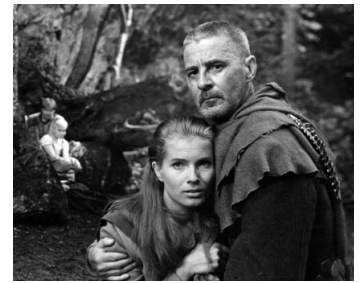
1957 LE SEPTIÈME SCEAU (Det sjunde inseglet) d'Ingmar Bergman avec Gunnel Lindblom