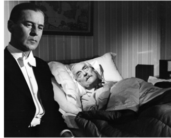
1957 LES FRAISES SAUVAGES (Smultronstället) d'Ingmar Bergman avec Victor Sjöström