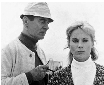
1969 LA PARTENAIRE (Violenza al sole) de Florestano Vancini avec Bibi Andersson