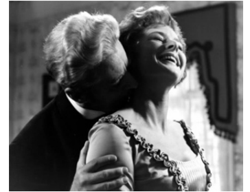
1965 STIMULANTIA, partie Daniel d'Ingmar Bergman avec Ingrid Bergman