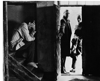
1967 LA HONTE (Skammen) d'Ingmar Bergman avec Max von Sydow, Liv Ullmann