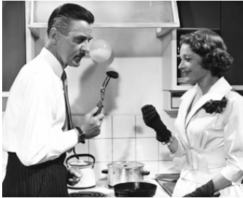
1957 ON CHERCHE UNE VILLA D'ÉTÉ (Sommarnöje söktes) d'Hasse Eckman avec Brigitte Reimer