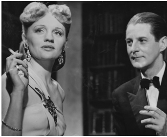
1946 À CHACUN SON CHEMIN (Var sin väg) d'Hasse Ekman avec Gunn Wallgren