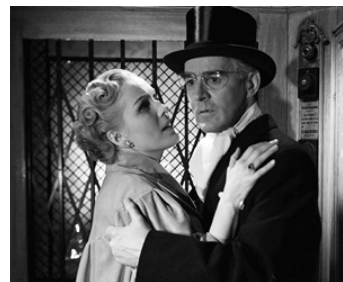
1951 L'ATTENTE DES FEMMES (Kvinnors väntan) d'Ingmar Bergman avec Eva Dahlbeck