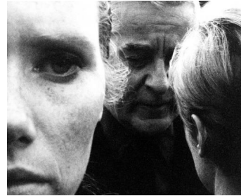
1965 PERSONA (Persona) d'Ingmar Bergman avec Liv Ullmann, Bibi Andersson