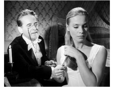
1958 LE VISAGE (Ansiktet) d'Ingmar Bergman avec Gunnel Lindblom