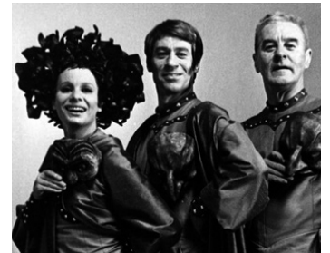
1969 LE RITE (Riten) d'Ingmar Bergman avec Ingrid Thulin, Anders Ek