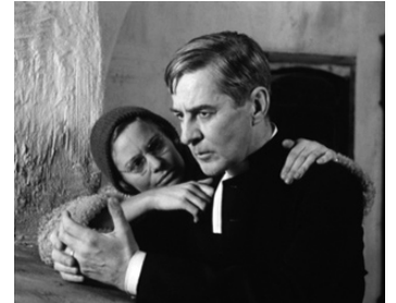
1962 LES COMMUNIANTS (Nattvardsgästerna) d'Ingmar Bergman avec Liv Ullmann