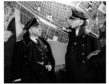
1944 VIVRE DANGEREUSEMENT (Lev farligt) de Lauritz Falk avec Börje Mellvig