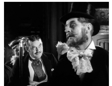
1953 LA NUIT DES FORAINS (Gycklarnas Afton) d'Ingmar Bergman avec Åke Grönberg