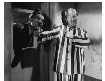
1948 SOLDAT BOUM (Soldat Bom) de Lars-Eric Kjellgren avec Nils Poppe