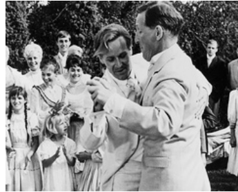
1964 LES AMOUREUX (Älskande par) de Mai Zetterling avec Jan Malmsjö