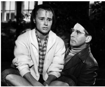
1954 UNE LEÇON D'AMOUR (En Lektion i Kärlek) d'Ingmar Bergman avec Harriet Andersson