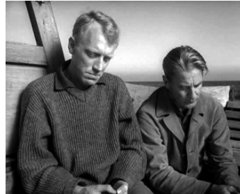
1961 À TRAVERS LE MIROIR (Såsom en spegel) d'Ingmar Bergman avec Max von Sydow