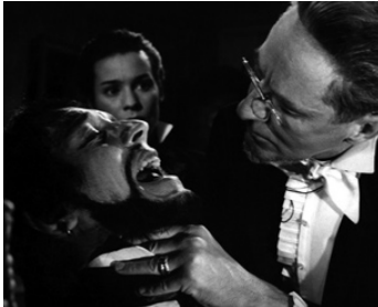
1960 L'ŒIL DU DIABLE (Djävulens öga) d'Ingmar Bergman avec Max von Sydow, Ingrid Thulin