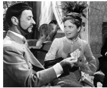
1955 SOURIRE D'UNE NUIT D'ÉTÉ (Sommarnattens leende) d'Ingmar Bergman avec Ulla Jacobsson