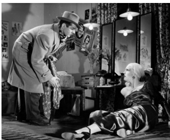
1947 DEUX FEMMES (Två kvinnor) d'Arnold Sjöstrand avec Eva Dahlbeck