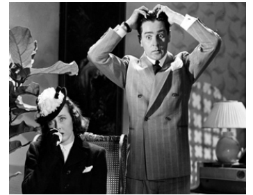
1945 SUSSIE (Vad vet ni om Sussie) d'Arne Mattsson avec Marguerite Viby